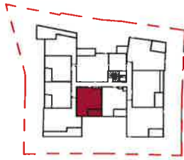
TABLEAU DE SURFACES